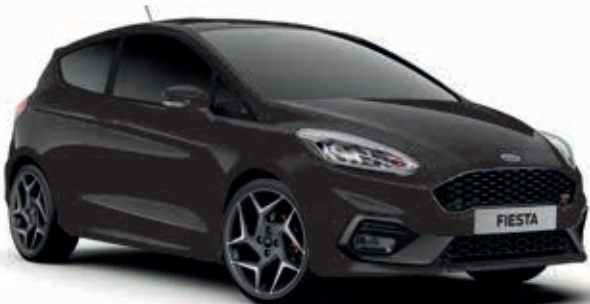
Agate Black Lakier metalizowany 1 000,-