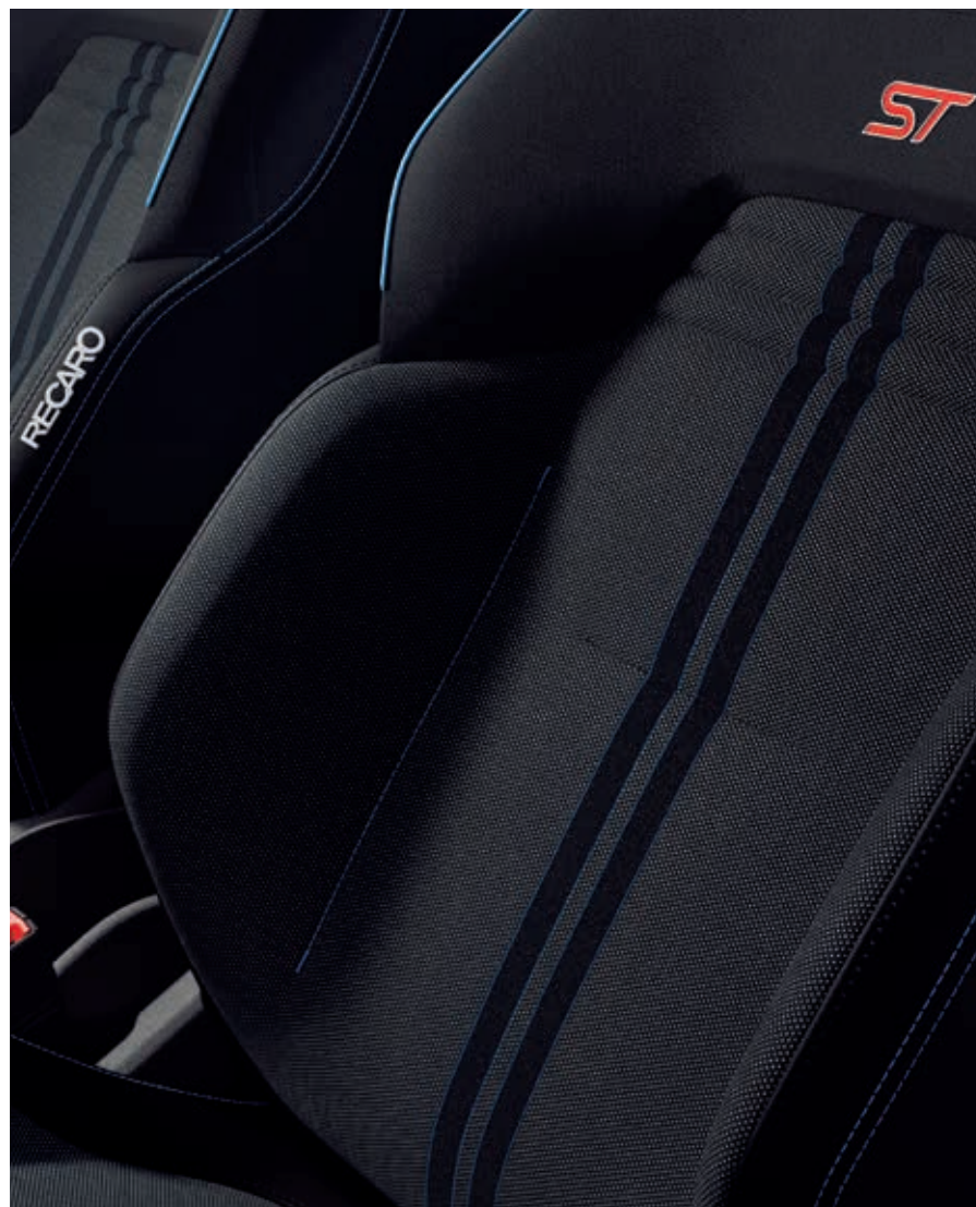
Fotele przednie Recaro z tapicerką materiałową Gozil (5ZQVF)