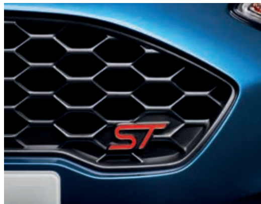
Unikalna krata wlotu powietrza w stylizacji ST