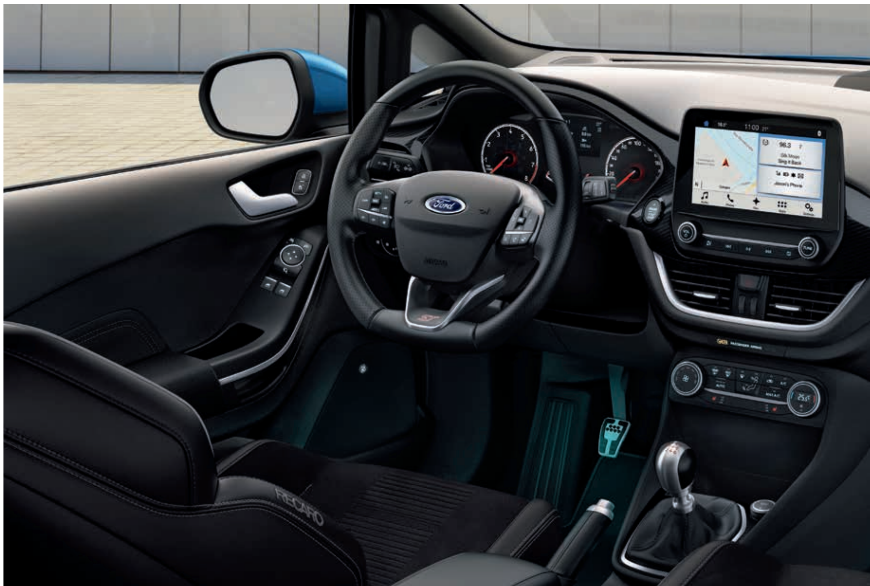
Ford Fiesta ST3 z opcjonalnym wyposażeniem