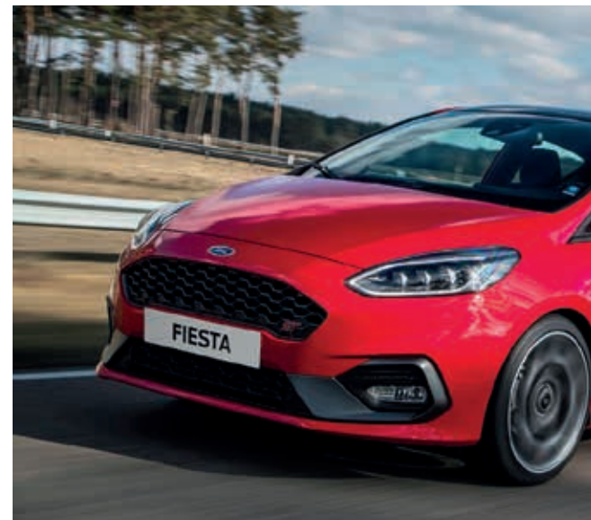
Ford Fiesta ST3 w kolorze Race Red (opcja)

• wyposażenie standardowe □ wyposażenie dostępne tylko w pakiecie lub z inną opcją