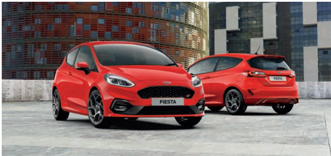
Ford Fiesta ST2 w kolorze Race Red (opcja)