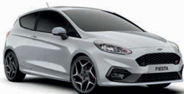
Moondust Silver Lakier metalizowany 1 000,-