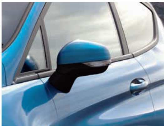
Lusterka boczne sterowane i podgrzewane elektrycznie