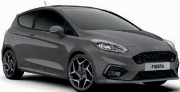
Magnetic Grey Lakier metalizowany 1 000,-