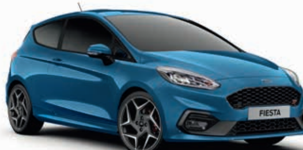
Performance Blue Lakier metalizowany 1 000,-