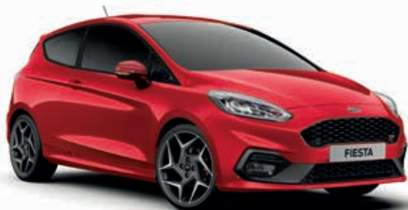
Race Red Lakier zwykły 600,-