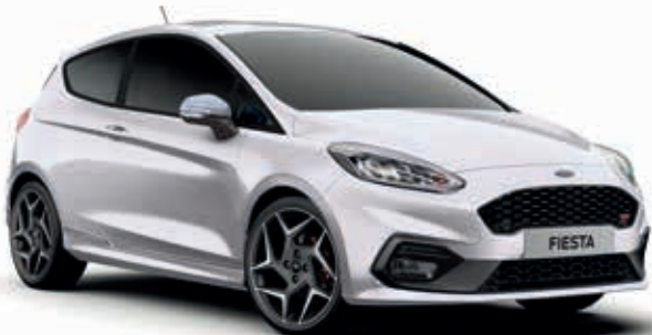
Frozen White Lakier zwykły bez dopłaty