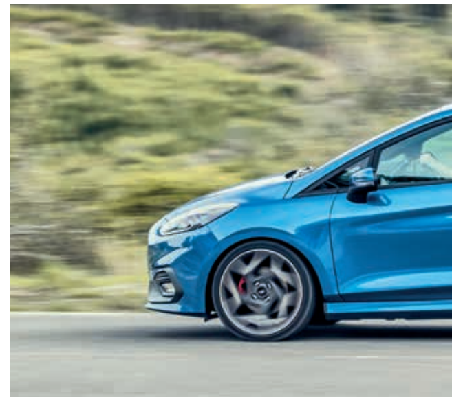
Ford Fiesta ST3 w kolorze Performance Blue (opcja)