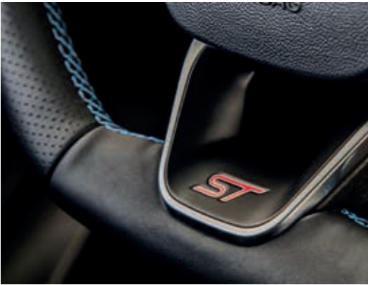
Kierownica 3-ramienna w stylizacji ST

ST2 - z niebieskimi przeszyciami standard ST3 - z czerwonymi przeszyciami standard