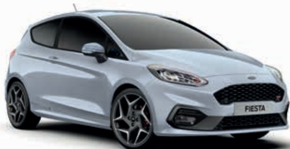
Silver Fox Lakier metalizowany specjalny 2 400,-