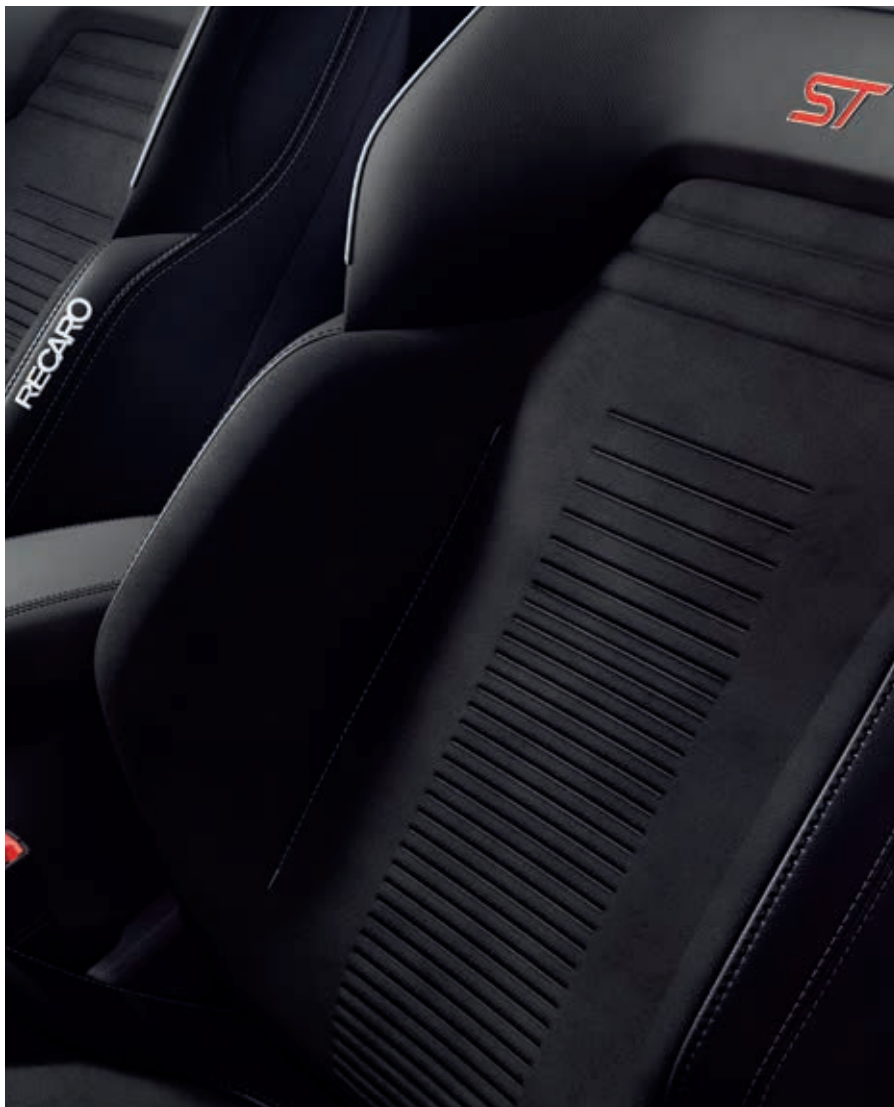
Fotele przednie Recaro z Tapicerką częściowo skórzana Dinamica (11PZH)