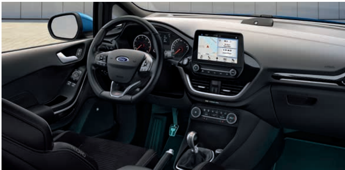
Ford Fiesta ST3