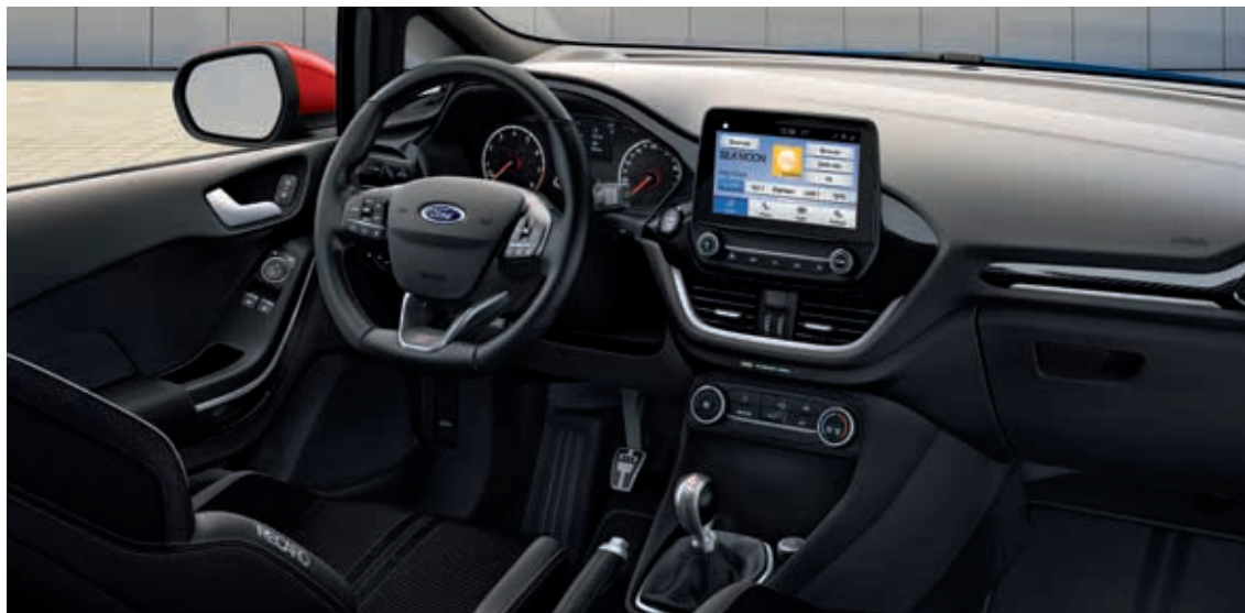
Ford Fiesta ST2

Ceny pokazane kolorem niebieskim są cenami promocyjnymi (rekomendowane ceny detaliczne brutto pomniejszone o rabat Ford Polska i sugerowany rabat Dealera Forda) i dotyczą wyłącznie klientów indywidualnych (detalicznych). Ceny promocyjne obowiązują do wyczerpania pojazdów objętych promocją. Klientów flotowych (firmy i osoby fizyczne prowadzące działalność gospodarczą bądź instytucje prowadzące działalność społeczną, zarejestrowane w Polsce i rejestrujące auto na terenie Polski) w sprawie zapytań ofertowych prosimy o kontakt z Autoryzowanym Dealerem Forda.