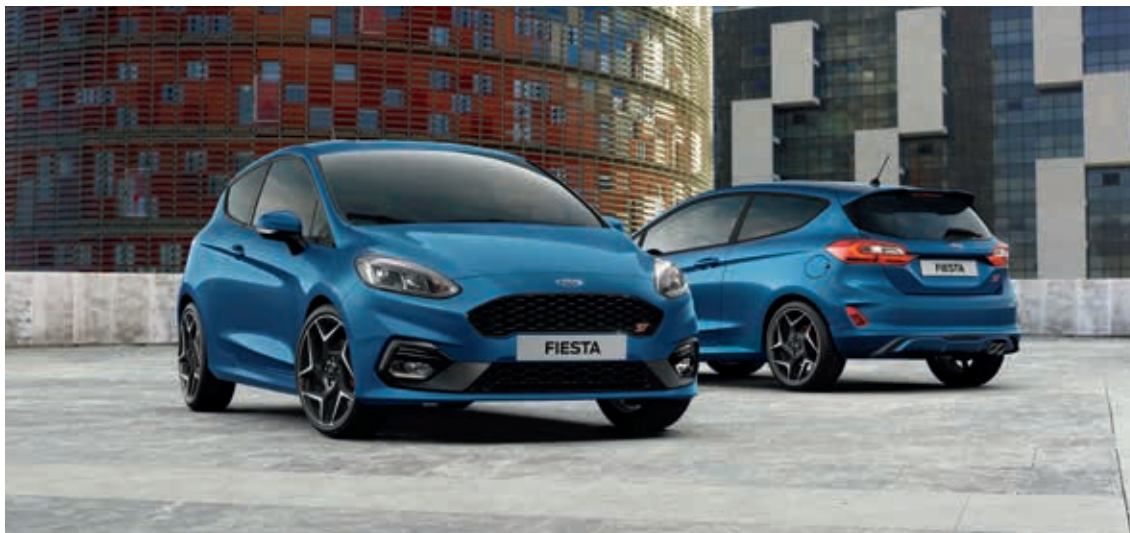
Ford Fiesta ST3 w kolorze Performance Blue (opcja)