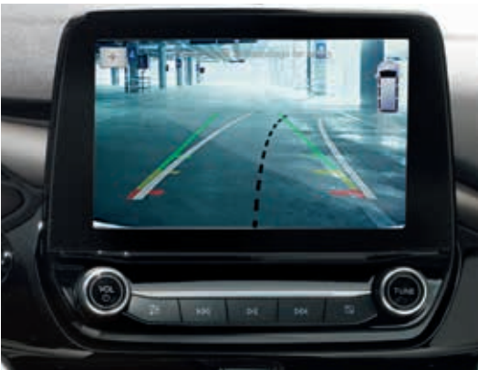
Kamera ułatwiająca parkowanie tyłem

● wyposażenie standardowe □ wyposażenie dostępne tylko w pakiecie lub z inną opcją