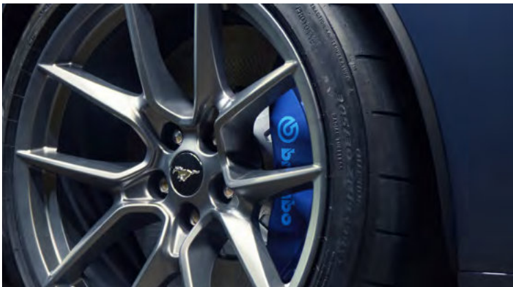
ZACISKI HAMULCOWE LAKIEROWANE NA NIEBIESKO, Z NIEBIESKIM LOGOTYPEM BREMBO™ Opcja dostępna tylko dla wersji DARK HORSE™ w pakiecie DARK HORSE™