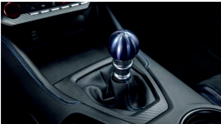
SPORTOWA, MANUALNA SKRZYŃNIA BIEGÓW TREMEC 3160 Standard dla wersji DARK HORSE™