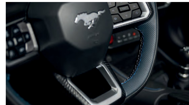
SPŁASZONA U DOŁU, PODGRZEWANA KIEROWNICA Standard dla wszystkich wersji. Dla wersji Dark Horse z niebieskimi przeszyciami