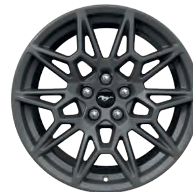
19" OBRĘCZE KÓŁ ZE STOPÓW LEKKICH STANDARD W WERSJI GT