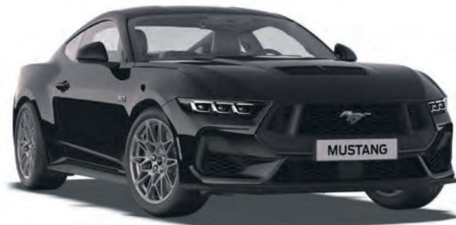
ABSOLUTE BLACK - LAKIER SPECJALNY 4 300,-