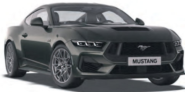
DARK MATTER GREY - LAKIER METALIZOWANY 4 300,-