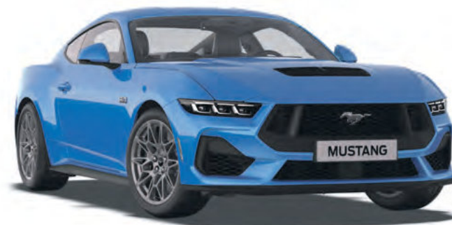
GRABBER BLUE - LAKIER METALIZOWANY SPECJALNY 6 200,-