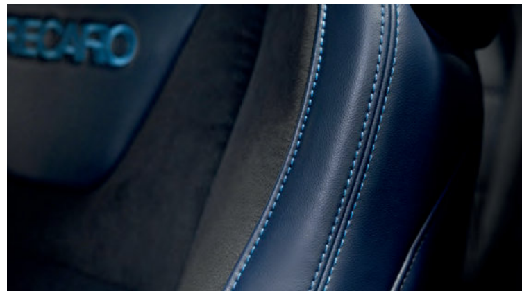
FOTELE RECARO Z TAPICERKĄ CZĘŚCIOWO SKÓRZANĄ W KOLORZE INDIGO BLUE 8 500,- dla wersji Dark Horse z pakietem Dark Horse