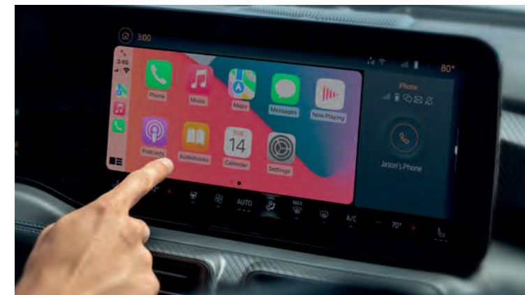
BEZPRZEWODOWA OBSŁUGA APPLE CARPLAY I ANDROID AUTO Standard dla wszystkich wersji