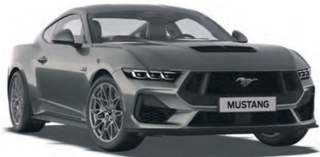
CARBONIZED GREY - LAKIER METALIZOWANY 4 300,-