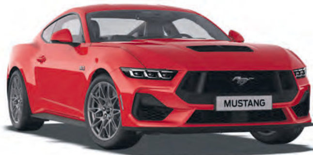
RACE RED - LAKIER ZWYKŁY 2 600,-