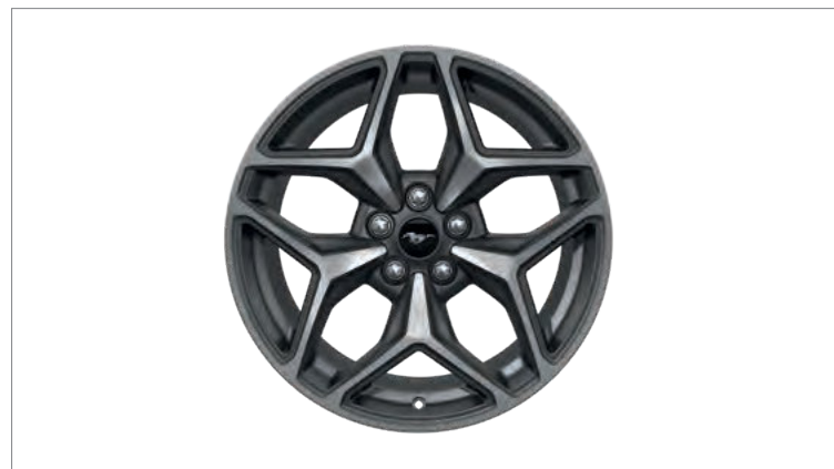
19" KUTE OBREĆCZE KÓŁ ZE STOPÓW LEKKICH 6 000,- dla wersji GT