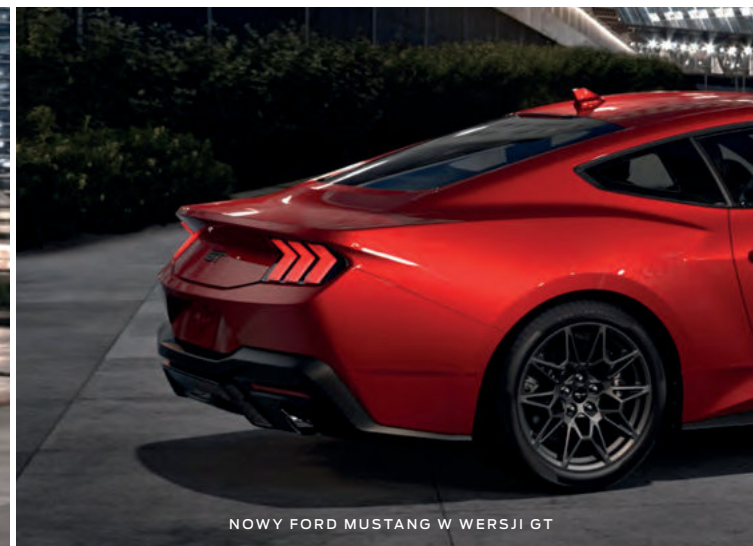
NOWY FORD MUSTANG W WERSJI GT

(ilustracje mogą nieznacznie różnić się od wersji produkcyjnej)