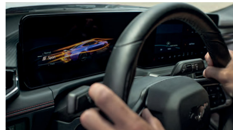
DRIVE MODE - SYSTEM WYBORU TRYBU JAZDY Standard dla wszystkich wersji