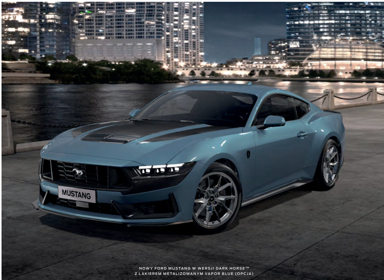
NOWY FORD MUSTANG W WERSJI DARK HORSE™ Z LAKIEREM METALIZOWANYM VAPOR BLUE (OPCJA)

(ilustracje mogą nieznacznie różnić się od wersji produkcyjnej)