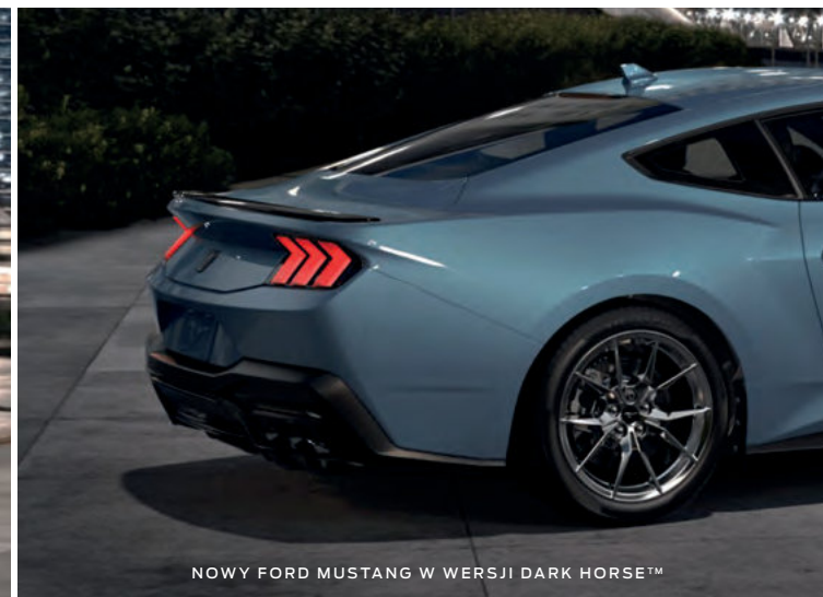
NOWY FORD MUSTANG W WERSJI DARK HORSE™

(ilustracje mogą nieznacznie różnić się od wersji produkcyjnej)