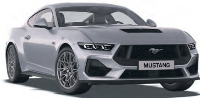
ICONIC SILVER - LAKIER METALIZOWANY 4 300,- | LAKIER NIEDOSTĘPNY DLA WERSJI DARK HORSE™