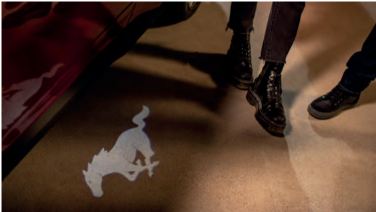
LUSTERKA BOCZNE Z PROJEKCJĄ LOGO „MUSTANG”