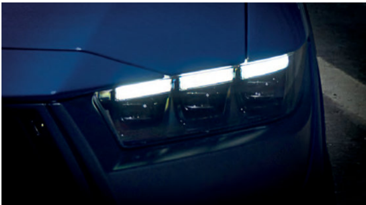
REFLEKTORY W TECHNOLOGII LED, Z CZARNYM TŁEM

Standard dla wszystkich wersji Dark Horse™. Dla wersji GT - z jasnym tłem