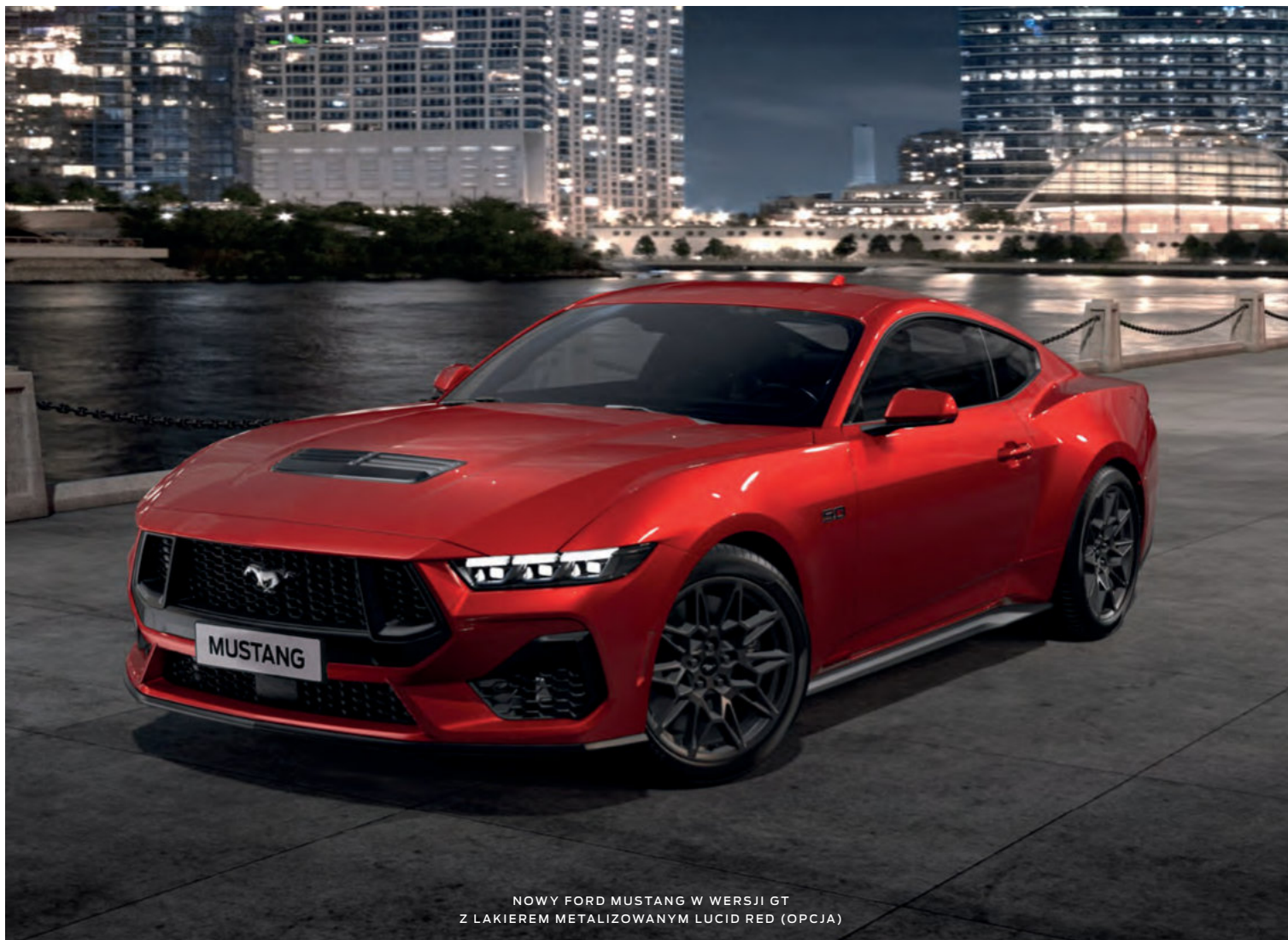
NOWY FORD MUSTANG W WERSJI GT Z LAKIEREM METALIZOWANYM LUCID RED (OPCJA)

(ilustracje mogą nieznacznie różnić się od wersji produkcyjnej)