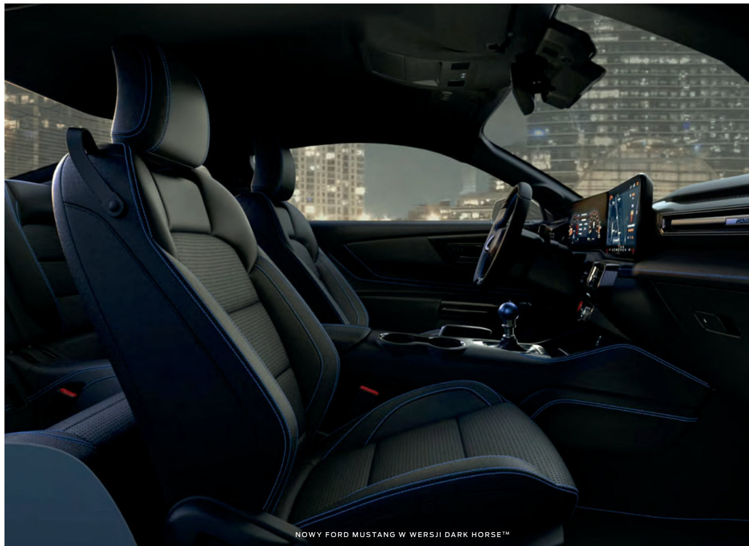
NOWY FORD MUSTANG W WERSJI DARK HORSE™

(ilustracje mogą nieznacznie różnić się od wersji produkcyjnej)