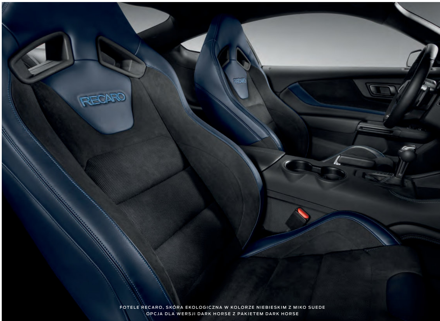
FOTELE RECARO, SKÓRA EKOLOGICZNA W KOLORZE NIEBIESKIM Z MIKO SUEDE OPCJA DLA WERSJI DARK HORSE Z PAKIETEM DARK HORSE