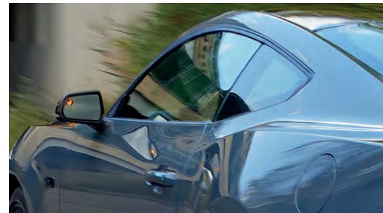
BLIND SPOT ASSIST Z CROSS TRAFFIC ALERT (CTA) - SYSTEM MONITOROWANIA MARTWEGO POLA WIDZENIA W LUSTERKACH Standard dla wszystkich wersji