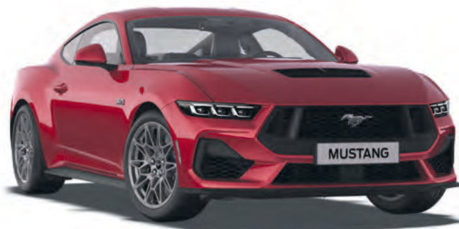
LUCID RED - LAKIER METALIZOWANY SPECJALNY 6 200,- | LAKIER NIEDOSTĘPNY DLA WERSJI DARK HORSE™