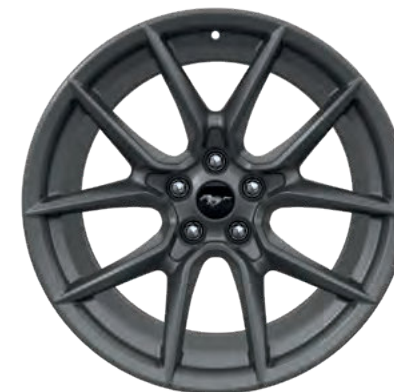
19" OBRĘCZE KÓŁ ZE STOPÓW LEKKICH STANDARD W WERSJI DARK HORSE™