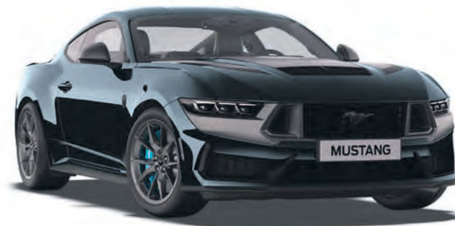
BLUE EMBER - LAKIER METALIZOWANY BEZ DOPLATY - DOSTĘPNY TYLKO Z PAKIEM STYLIZACYJNYM DARK HORSE