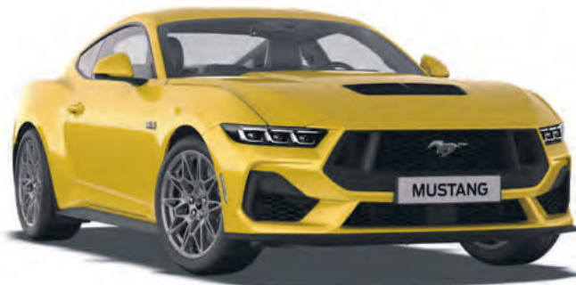
YELLOW SPLASH - LAKIER METALIZOWANY 4 300,- | LAKIER NIEDOSTĘPNY DLA WERSJI DARK HORSE™