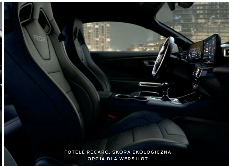
FOTELE RECARO, SKÓRA EKOLOGICZNA OPCJA DLA WERSJI GT