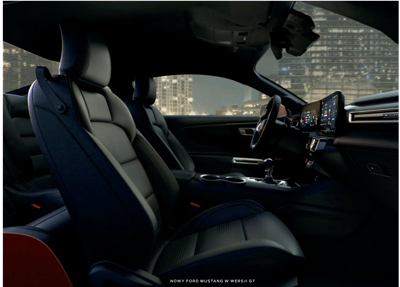
NOWY FORD MUSTANG W WERSJI GT

(ilustracje mogą nieznacznie różnić się od wersji produkcyjnej)