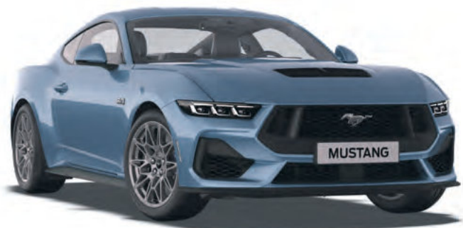
VAPOR BLUE - LAKIER METALIZOWANY SPECJALNY 6 200,-