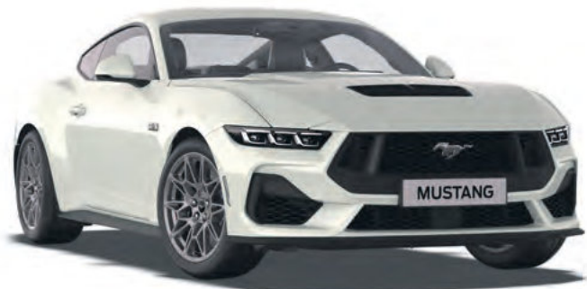
OXFORD WHITE - LAKIER ZWYKŁY BEZ DOPLATY